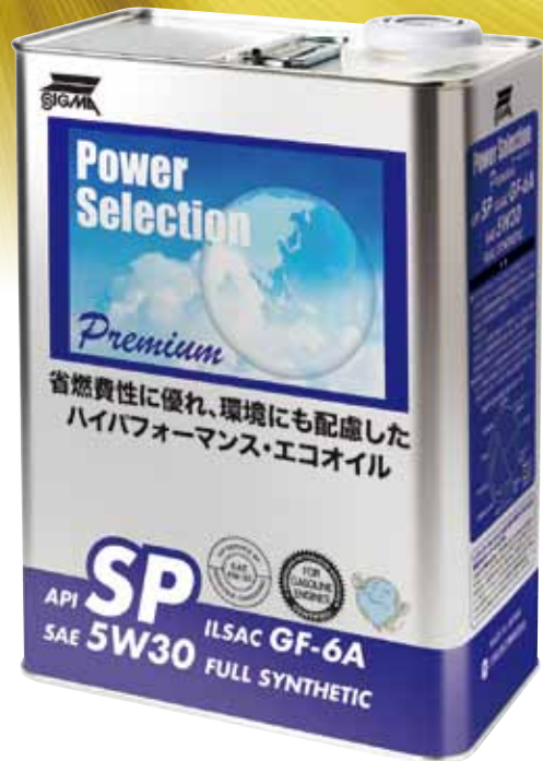
パワーセレクション プレミアム API SP ILSAC GF-6A SAE 5W30 FULL SYNTHETIC