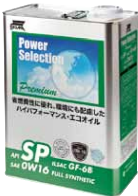
パワーセレクション プレミアム API SP ILSAC GF-6B SAE 0W16 FULL SYNTHETIC