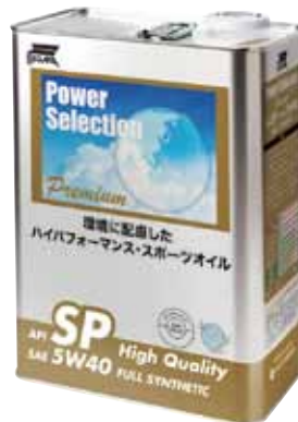
パワーセレクション プレミアム API SP High Quality SAE 5W40 FULL SYNTHETIC

パワーセレクション エクストラ API SN ILSAC GF-5 SAE 10W30 FULL SYNTHETIC パワーセレクション エクストラ API SN ILSAC GF-5 SAE 5W20 FULL SYNTHETIC