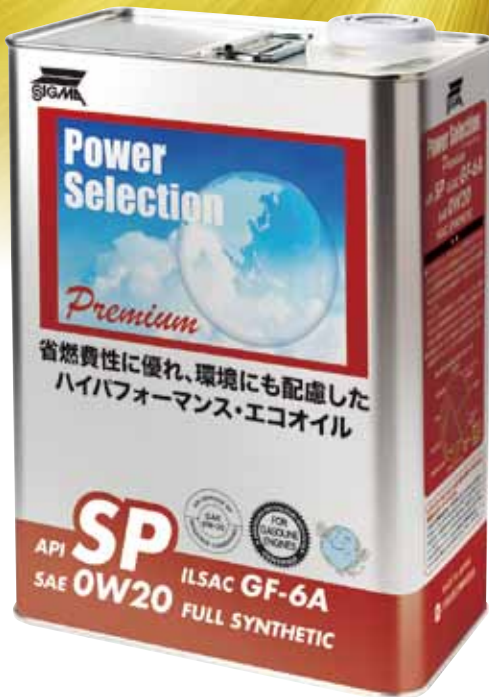
パワーセレクション プレミアム API SP ILSAC GF-6A SAE 0W20 FULL SYNTHETIC